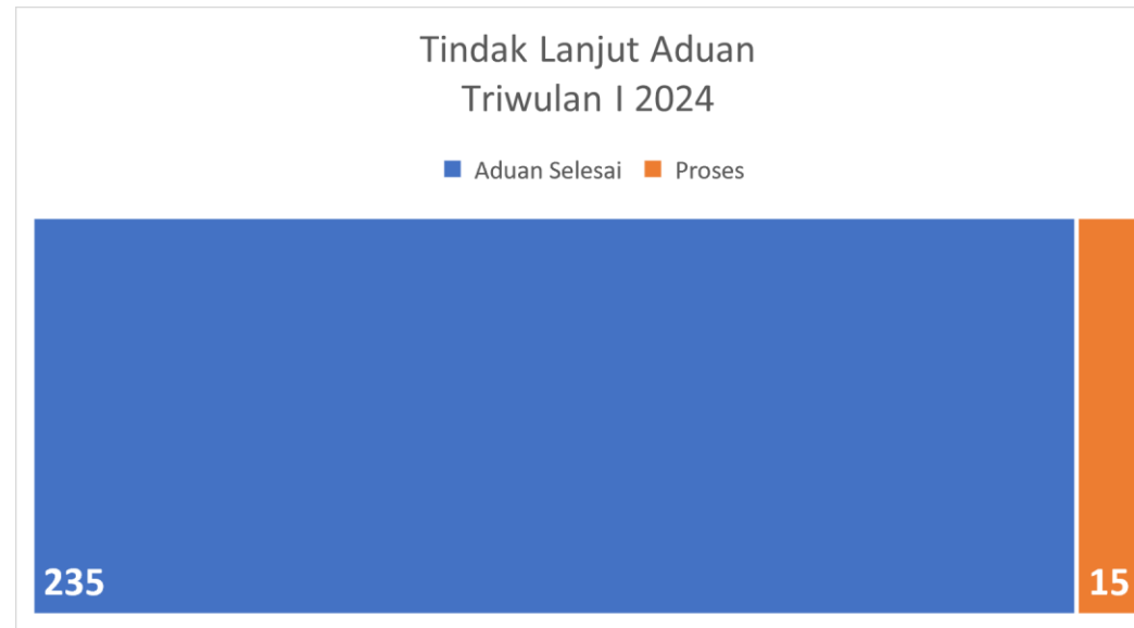
Diagram di atas menunjukkan perbandingan aduan yang telah selesai dan yang masih proses. Dari 250 aduan yang masuk pada Triwulan I Tahun 2024, 235 Aduan terselesaikan dan 15 masih dalam proses